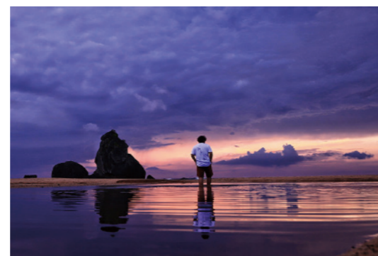
《朝散歩》積 信一 (奄美市)

[評] 朝焼けが葉っぱに落ちた白い花を照らす。光の加減が秀逸だ。柔らかな太陽光と植物が醸す深い色彩のコントラストが作品を力強くみせる。サガリバナの花言葉は「幸運が訪れる」。束の間がくれた贈り物だ。