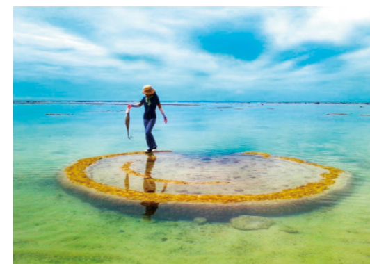
《ネリヤカナやまわり舞台》大島 英世 (宇検村)

[評] 挑戦と意欲が随所に見える。朝日の前で海に佇む男性、ごわごわとした雲、景色を映す鏡のような水面。全てが計算し尽くされた方程式のようで、いつもの光景とのギャップに驚く。撮影も画像処理もハイレベル。