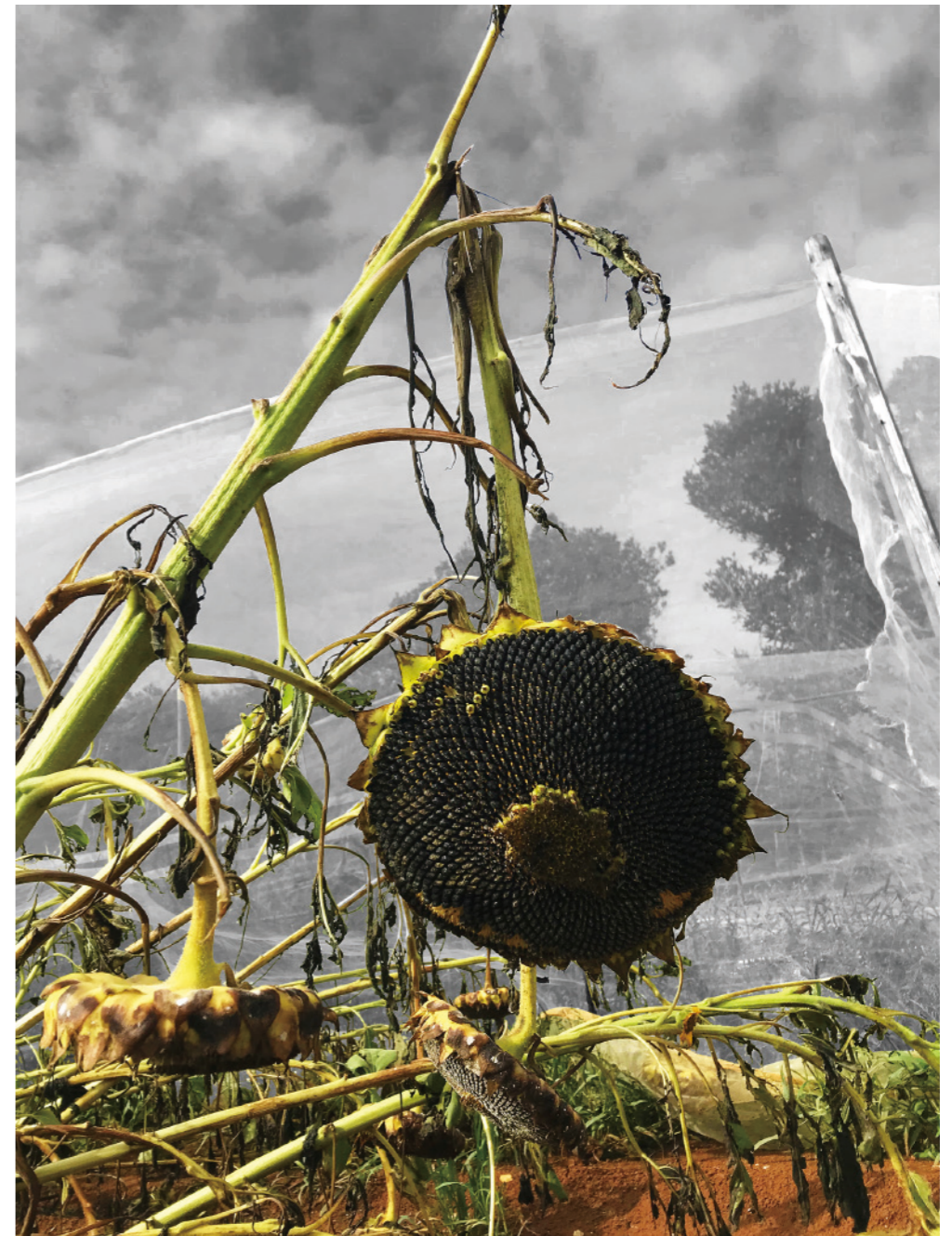
《赤い土》園 こうじろう（知名町）

[ 評 ] 枯れたヒマワリ、赤土の彩色でまとめた配色が巧み。モノクロの背景が被写体のスケール感を増幅させる。一つ間違えれば平凡に終わる風景。作画が作品を強くした。繊細な表現力。作者の技量が素晴らしい。