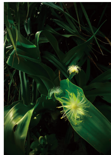
《夜明けのおくりもの》秋元 愛 (福岡県)

[評] 朝焼けが葉っぱに落ちた白い花を照らす。光の加減が秀逸だ。柔らかな太陽光と植物が醸す深い色彩のコントラストが作品を力強くみせる。サガリバナの花言葉は「幸運が訪れる」。束の間がくれた贈り物だ。